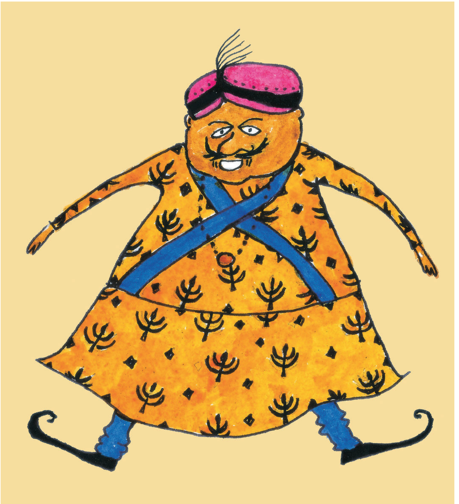
Wanan Sarki ne mai kiba