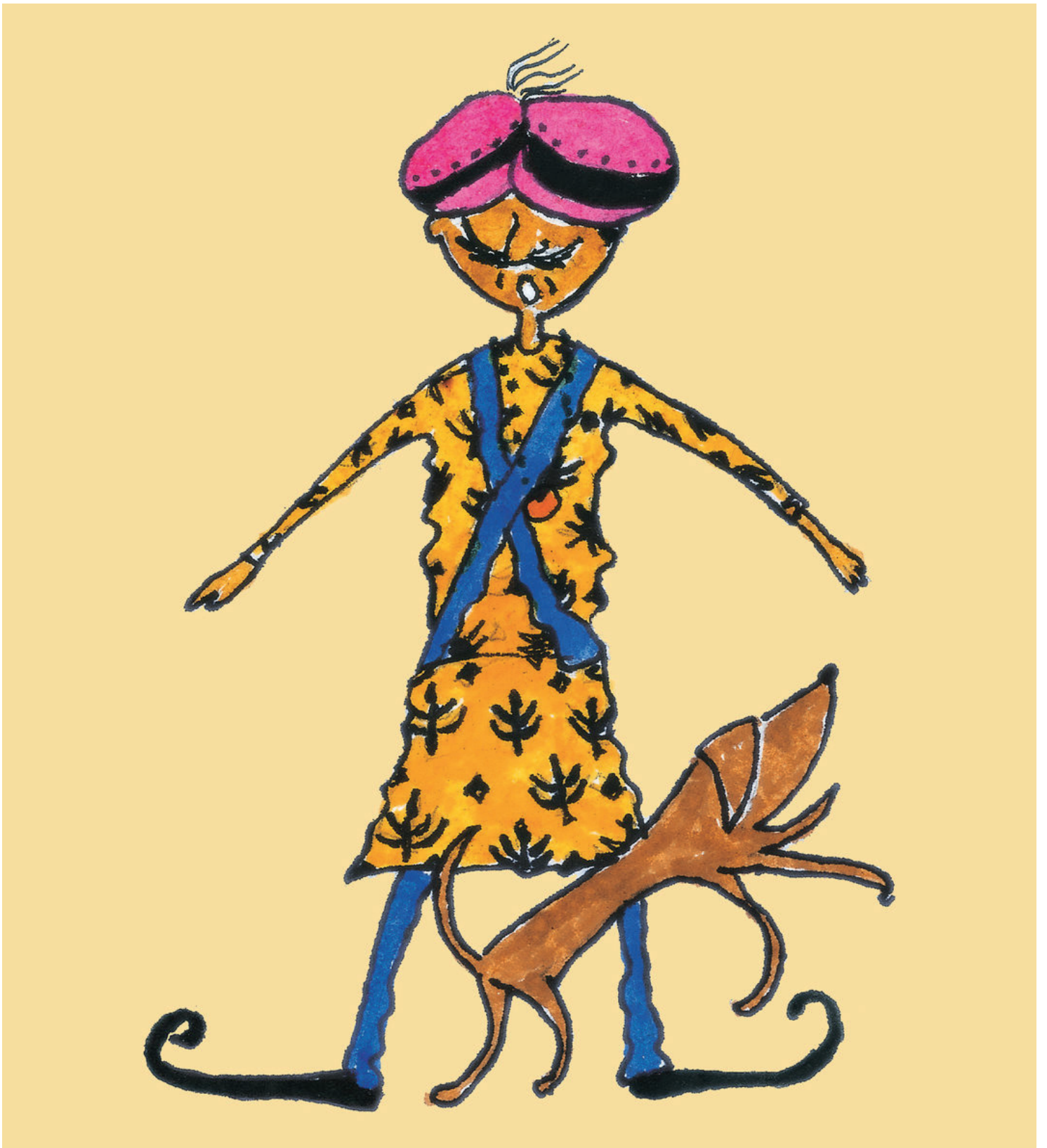
Yanzu Sarki mai kiba ya rame.