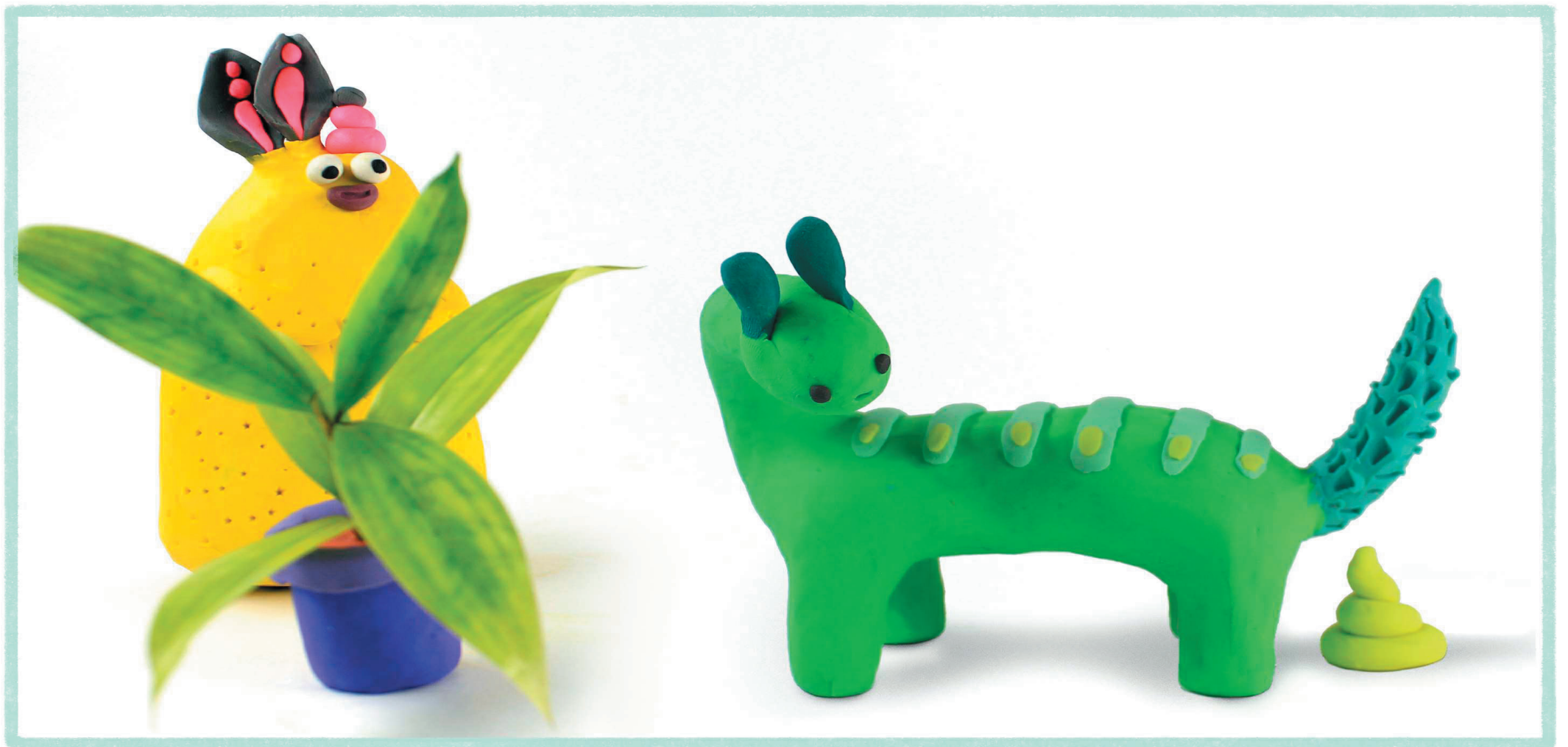
Les monstres qui jouent à cache-cache Les monstres qui font des crottes