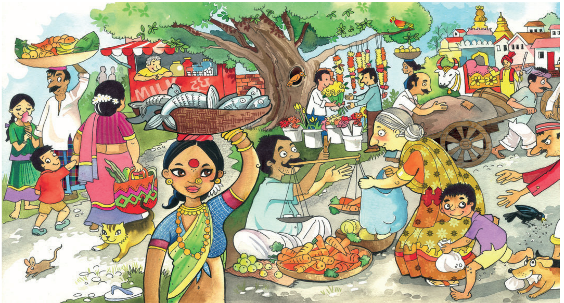
Il traverse le marché.